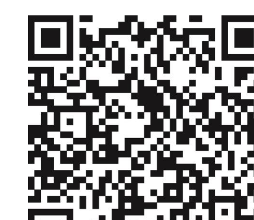
Weitere Informationen BZgA

Hotlines zum neuen Coronavirus Bundesministerium für Gesundheit: 030 346 465 100 Unabhängige Patientenberatung Deutschland: 0800 0117722 Patientenservice: 116 117