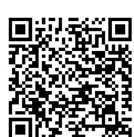
**Corona-Regelungen in den Bundesländern

Hotlines zum neuen Coronavirus Bundesministerium für Gesundheit: 030 346 465 100 Unabhängige Patientenberatung Deutschland: 0800 0117722 Patientenservice: 116 117