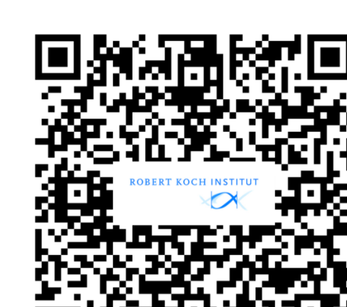
Weitere Informationen RKI