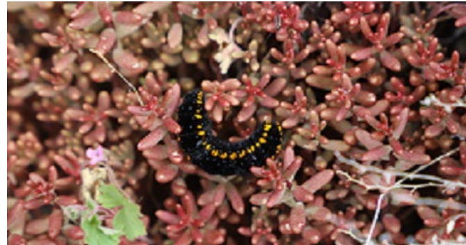
Die Weiße Fetthenne ist die Futterpflanze der Raupen.

Das Monitoring startete im Frühjahr 2021 mit der Raupensuche und soll vorerst genau ein Jahr später erneut mit dem Erfassen der Raupen enden.