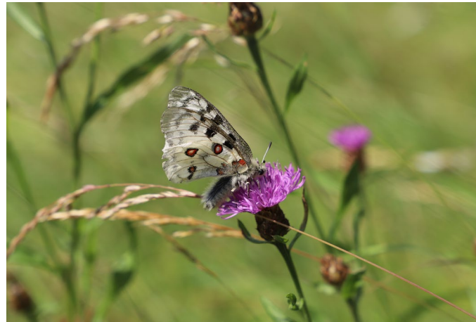
Der Mosel-Apollo beim Blütenbesuch.

Die Kreise Mayen-Koblenz und Cochem-Zell sind sich ihrer Verantwortung gegenüber dem Mosel-Apollo und seiner Bedeutung für die Kulturlandschaft bewusst.